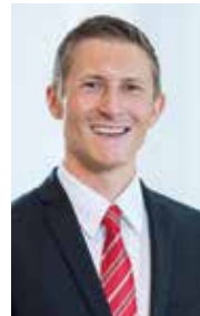
Autor: Prof Dr. Marco Wölfle

JETZT INFORMIEREN: vwa-freiburg.de/digitalisierungsmanager